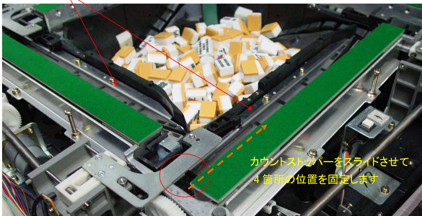
カウントストッパー